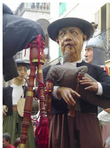
Gegants de les illes