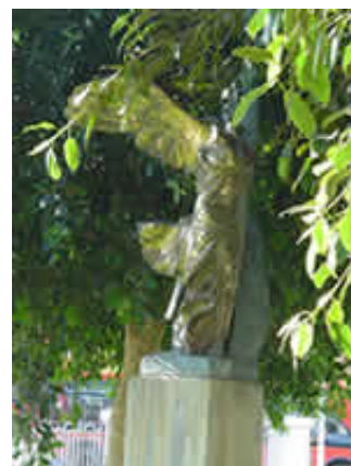
Esculturas de Palma