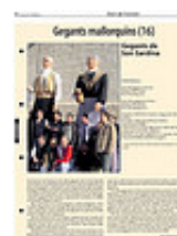
Fitxes Gegants mallorquins